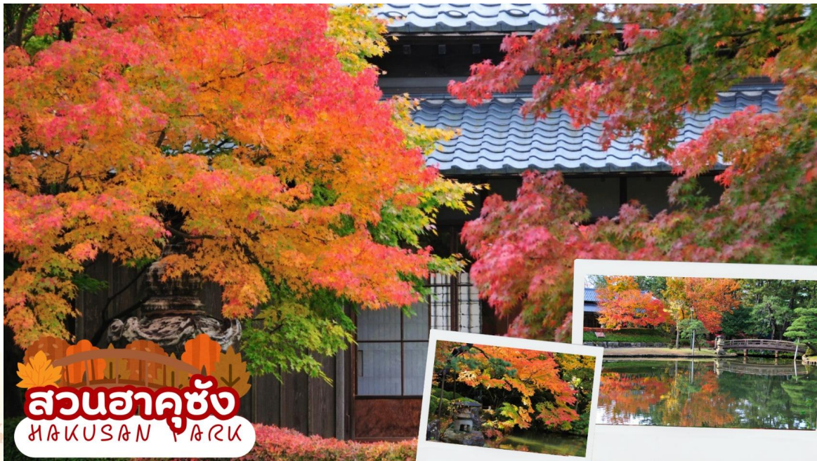
สวนฮาคุซัง HAKUSAN PARK

สวนฮาคุซัง (Hakusan Park) เป็นสวนสาธารณะประจำเมืองนิงะตะ ที่ออกแบบโดยได้รับแรงบันดาลใจจากชาวดัตช์ ตั้งอยู่ติดกับ ศาลเจ้าฮาคุซัง (Hakusan Shrine) และได้รับการยอมรับว่าเป็นหนึ่งในสวนสาธารณะในเมือง 100 อันดับแรกของญี่ปุ่น สวนมีความงามตามฤดูกาลที่หลากหลาย เช่น ดอกซากุระในฤดูใบไม้ผลิ ดอกบัวในฤดูร้อน ใบไม้เปลี่ยนสีในฤดูใบไม้ร่วง และหิมะในฤดูหนาว (ใบไม้เปลี่ยนสีขึ้นอยู่กับสภาพอากาศ)